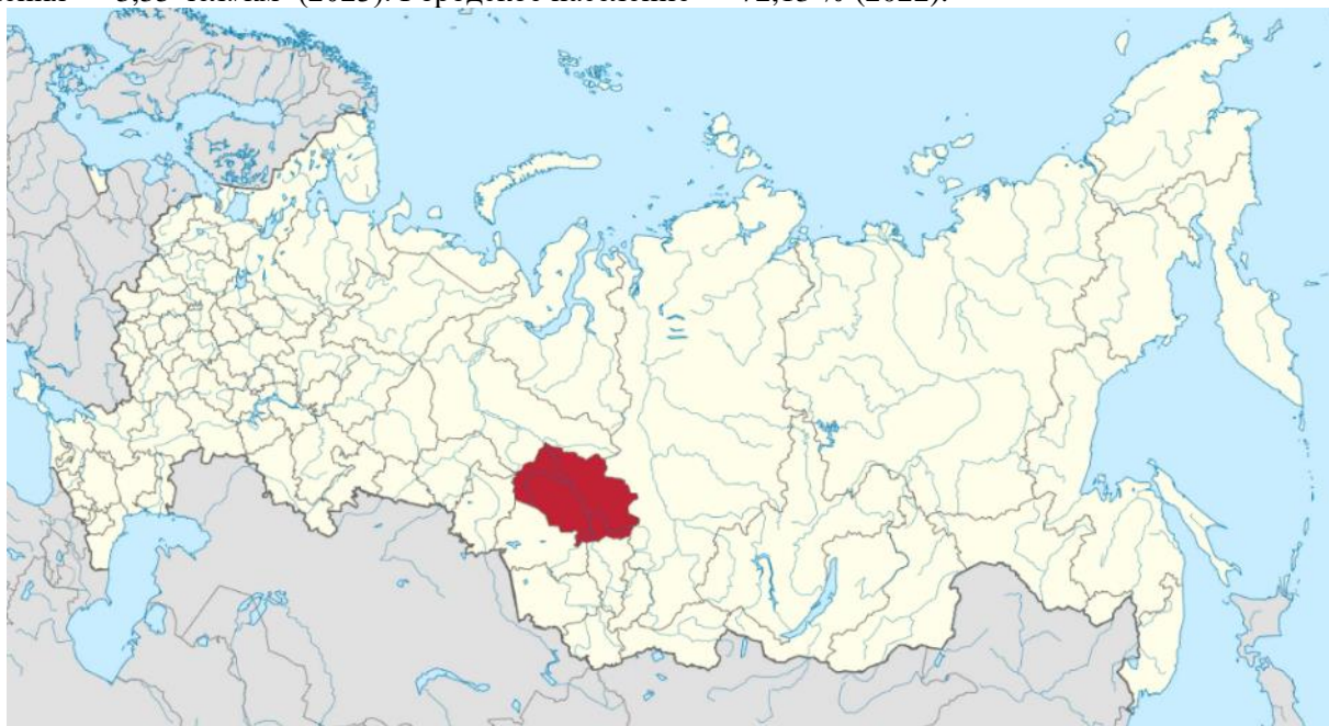
Рисунок 1. – Расположение Томской области на карте Российской Федерации

Численность населения области по данным Росстата составляет 1 052 106 чел. (2023). Плотность населения — 3,35 чел./км 2 (2023). Городское население — 72,13 % (2022).